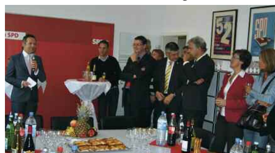
Neue Räume für die Zukunft. Michael Roth begrüßt zur Eröffnung der neuen Landesgeschäftsstelle.