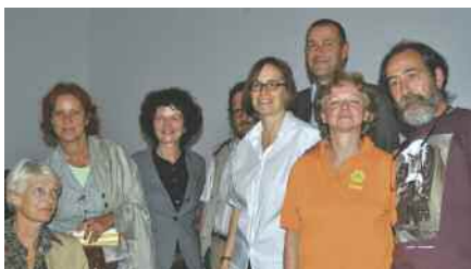
Dr. Judith Pauly-Bender (MdL) freut sich über die große Resonanz.

A ber 300 Interessierte folgten am 24. September der Einladung der tierschutzpolitischen Sprecherin der SPD-Landtagsfraktion, Judith Pauly-Bender, und Vertretern des Landestierschutzverbandes und besuchten im Hessischen Landtag die Veranstaltung „Tier-